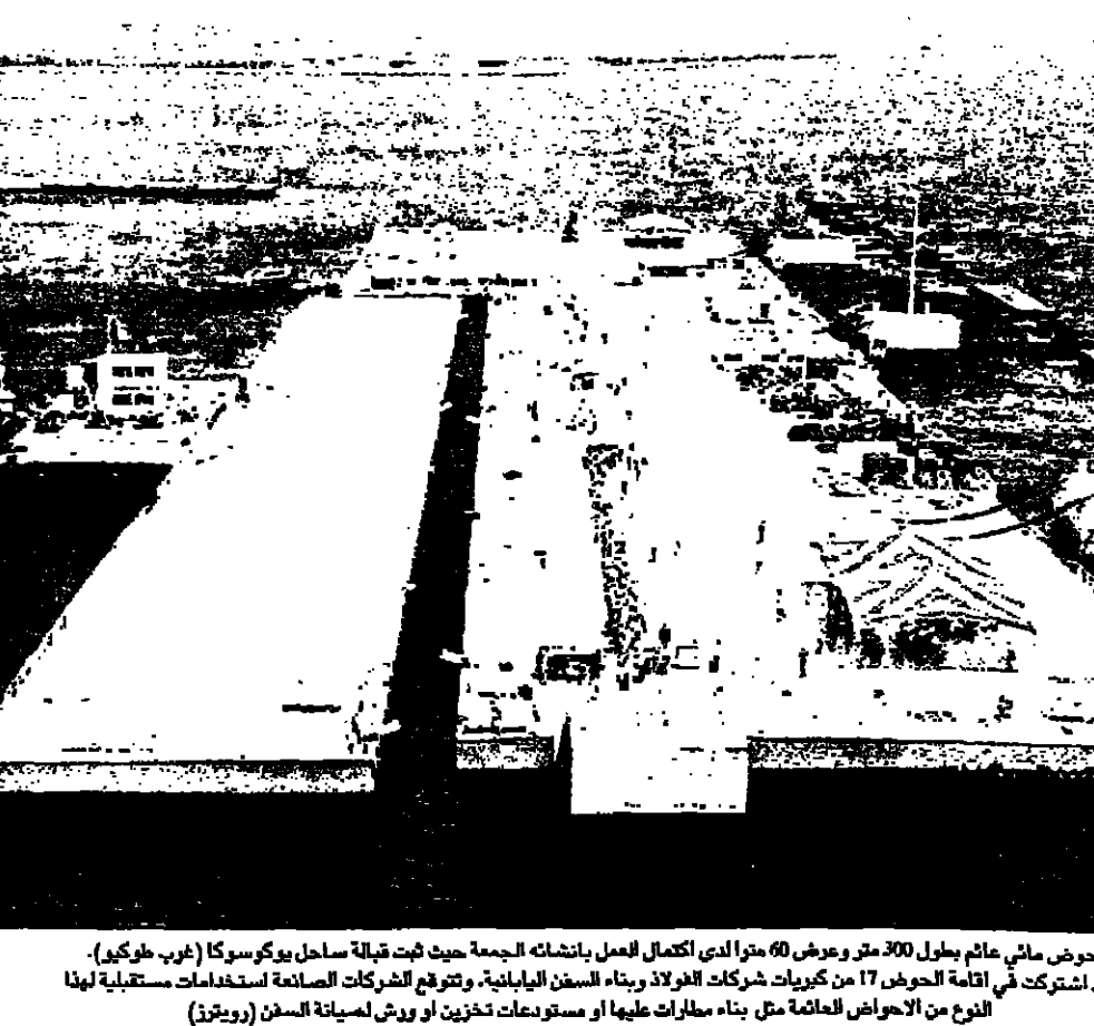
حوض مائي ماثم بطول 300 متر وعرض 60 مترا لدى اكتمال العمل بإنشاء الجمة حيث قبله ساحل بوركوسكا (غرب طوكيو). وفي ائتراك في اقامة الحوض من 17 كوريات شركات الغرلا وبناء السفن اليابانية. وترتفع الشركات الصانعة استخدامات مستقبلي لها النوع من الاحواض العائمة مثل بناء سفنات عليها او مستودعات تخزين او ورس لمسية للسفن

جاكرتا - رويترز - أعلنت الحكومة الجديدة يوسف حبيشي سوق الاسهم في جاكرتا دفعة متوسطة الجمعة ولكن لم يكن لهذه التغييرات اثره على الروبية.